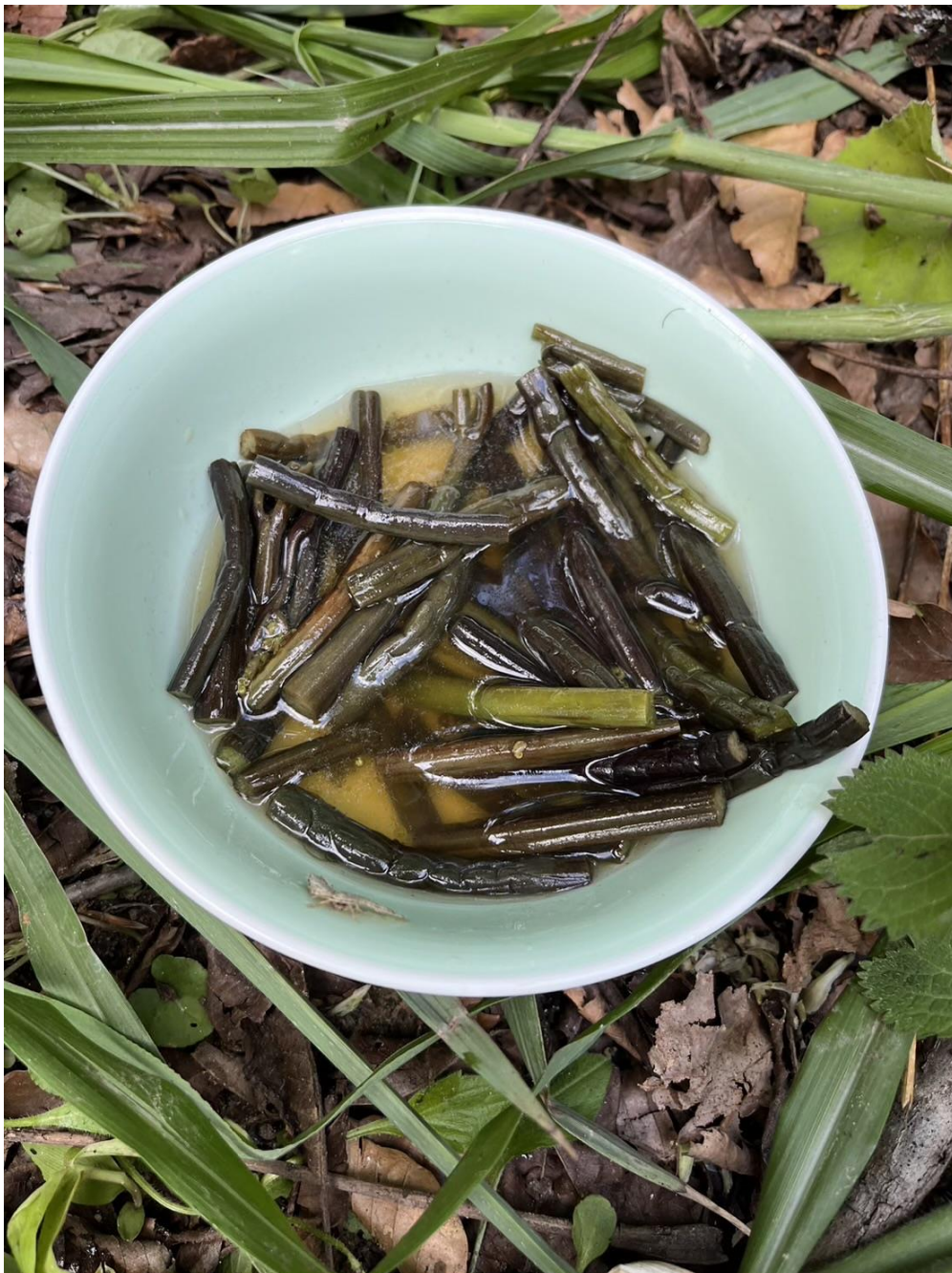
大貫さん自家製わらび