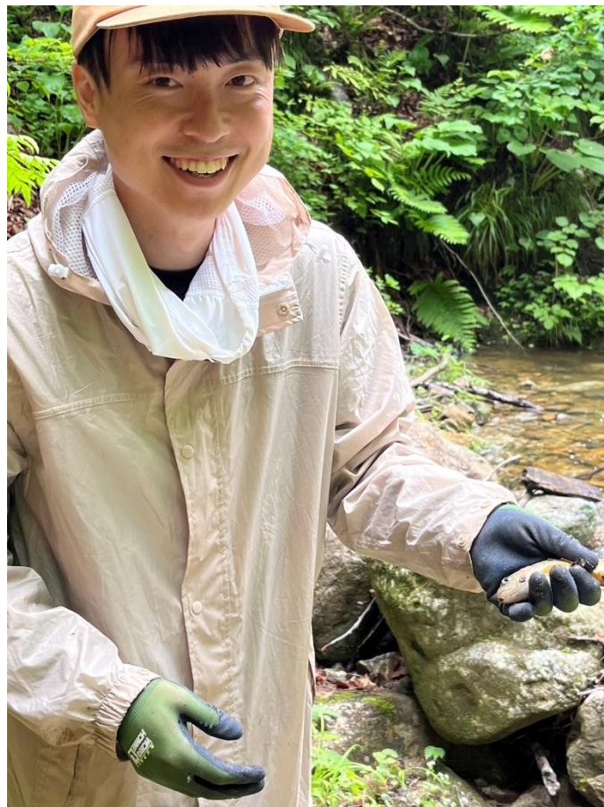
佐藤くんもルアーで