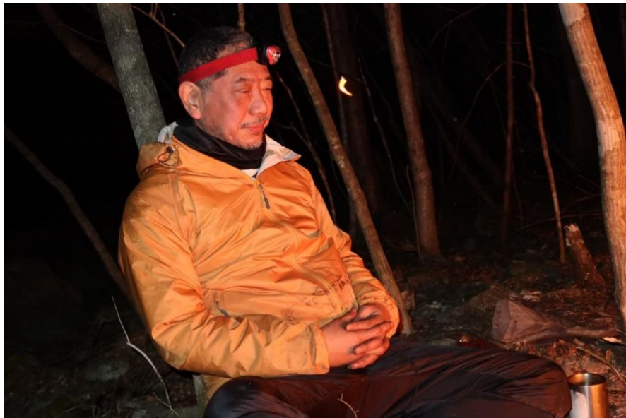
高級ホテルの快適さにウトウト