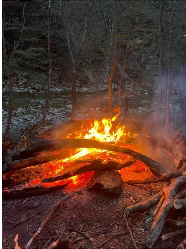
焚き火に癒されます