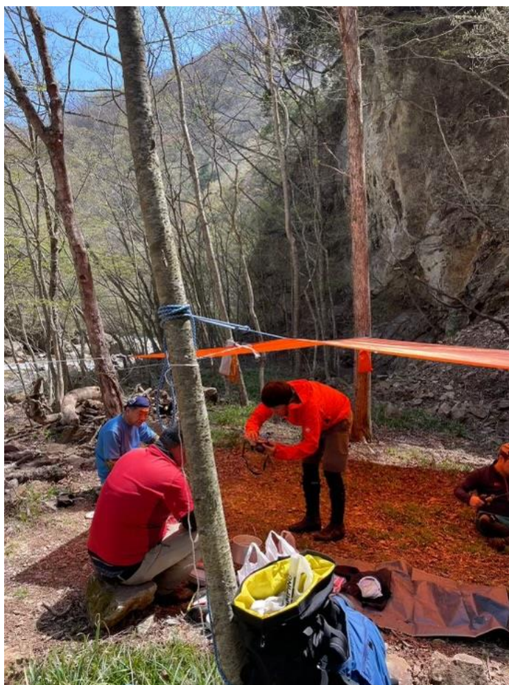
今宵の高級ホテル室内風景

1時間程でテンバに到着！各々薪集めタープ張りとは瞬で極上のテンバが完成、先輩方の段取りのよさに毎回脱帽です。