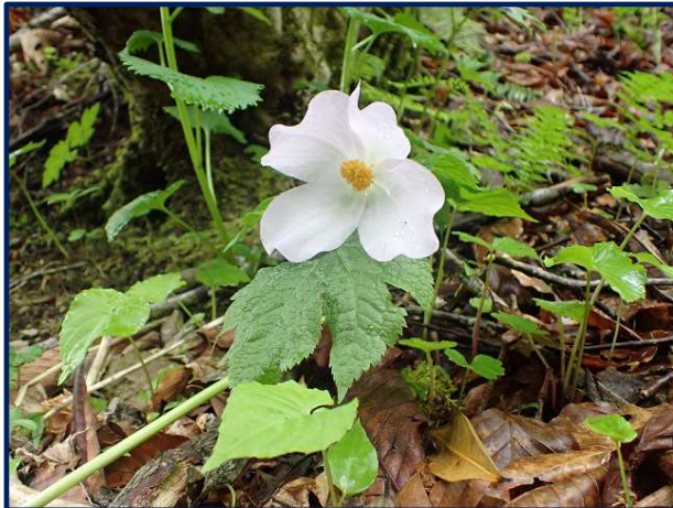
いつものようにシラネアオイが満開でした