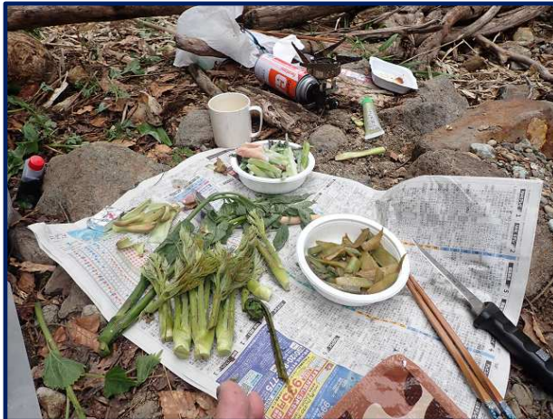
タラの芽は定番の天ぷらで