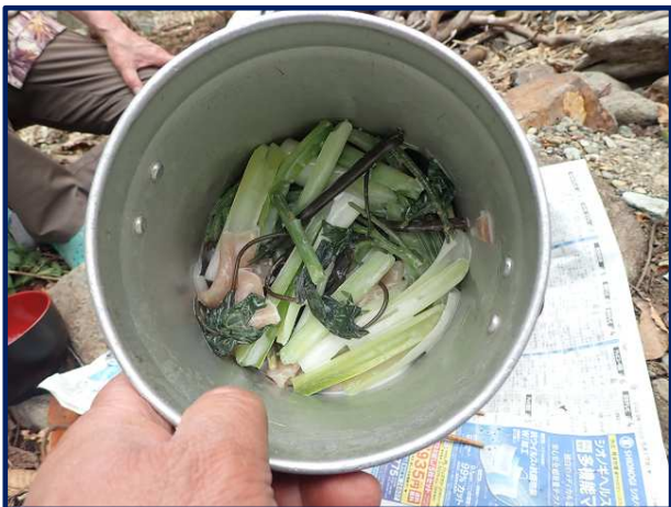
しゃきしゃきウルイ、もみじ傘 & 生ハムサラダ